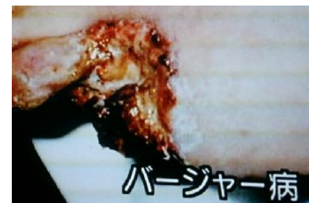
有害物質による血管の詰まり。写真は足の小指が無くなった状態。