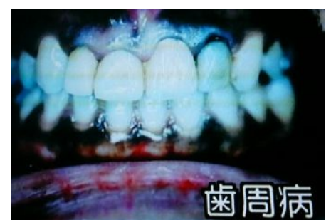
煙の有害物質が直接触れて