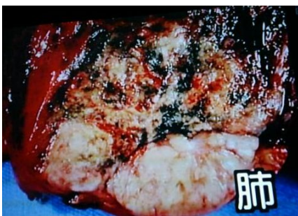
タールと一酸化炭素