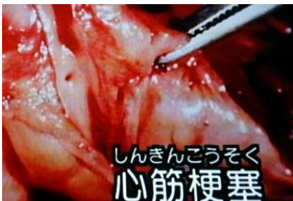
有害物質、一酸化炭素などで血管が詰まる